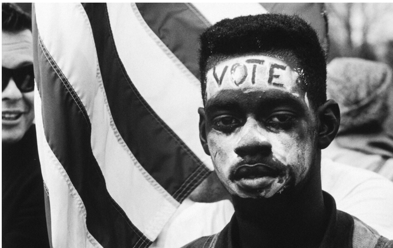
Lutte pour les droits civiques (James Karales)

Nausée : « Les célèbres abattoirs [de Chicago] — aujourd'hui déplacés — empestent à plusieurs lieues à la ronde. J'ai la curiosité morbide de voir égorger en série et mettre en boîtes porcs et moutons. À en avoir la nausée. Encore épargne-t-on aux âmes sensibles la vue, sans doute insoutenable, du massacre des bovidés. » ( Le Feu du sang — autobiographie politique et charnelle , éditions Grasset & Fasquelle, 1977)