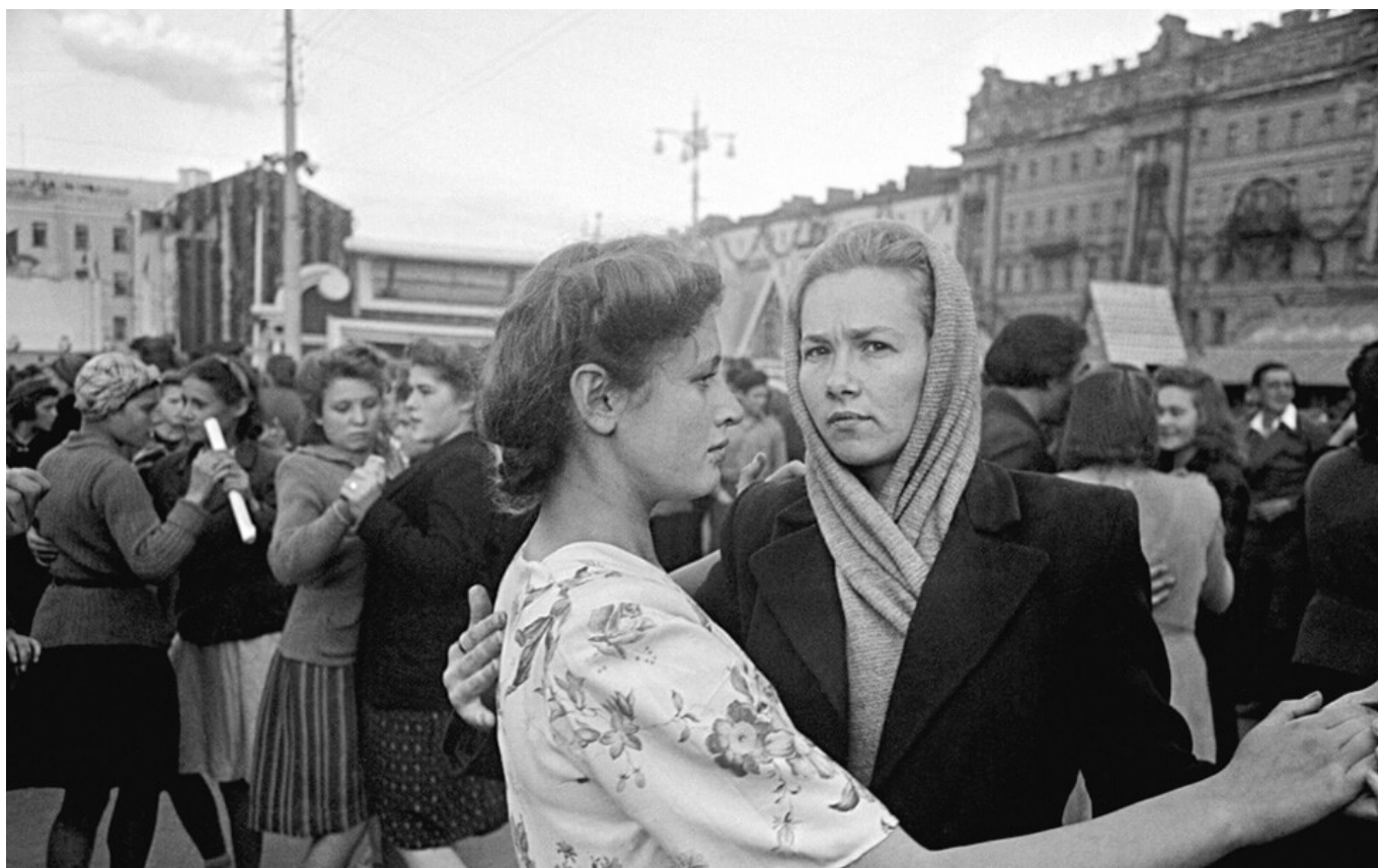
Moscou, URSS, 1947

Vélos : « Au surplus, ma venue aux idées révolutionnaires avait été, pour une part plus ou moins large, le produit de mon homosexualité, qui avait fait de moi, de très bonne heure, un affranchi, un asocial, un révolté. Dans mes essais autobiographiques, j'ai rapporté que mes convictions n'avaient pas tant été puisées dans les livres et les journaux révolutionnaires, bien que j'en eusse absorbé des quantités énormes, que dans le contact physique, vestimentaire, fraternel, pour ne pas dire spirituel, dans la fréquentation des cadres de vie de la classe prolétaire. J'ai appris et découvert bien davantage chez tel marchand de vélos, avec sa clientèle de loubards, dans telle salle de boxe et de lutte libre du quartier de Ménilmontant. J'ai échangé plus de libres et enrichissants propos dans l'arrière-boutique fumeuse de tel petit resto ouvrier, peuplé de célibataires endurcis, que dans les appartements cossus des quelques anciens condisciples que je m'étais forcé de continuer à fréquenter. » ( Homosexualité et révolution, Le vent du ch'min, 1983 )