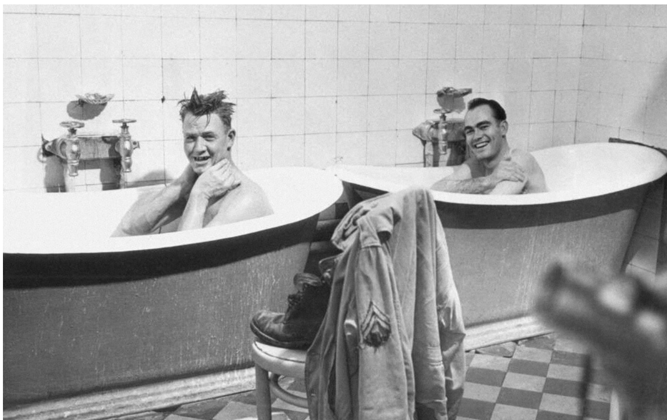
Deux soldats américains à Dijon

Internationalisme : « Le principe fédéraliste conduit logiquement à l'internationalisme, c'est-à-dire à l'organisation fédérative des nations dans la grande et fraternelle union internationale humaine . [...] Les États-Unis d'Europe, d'abord, et, plus tard, ceux du monde entier, ne pourront être créés que lorsque, partout, l'ancienne organisation fondée, de haut en bas, sur la violence et le principe d'autorité, aura été renversée. » ( L'Anarchisme , Gallimard, 1965-1981)