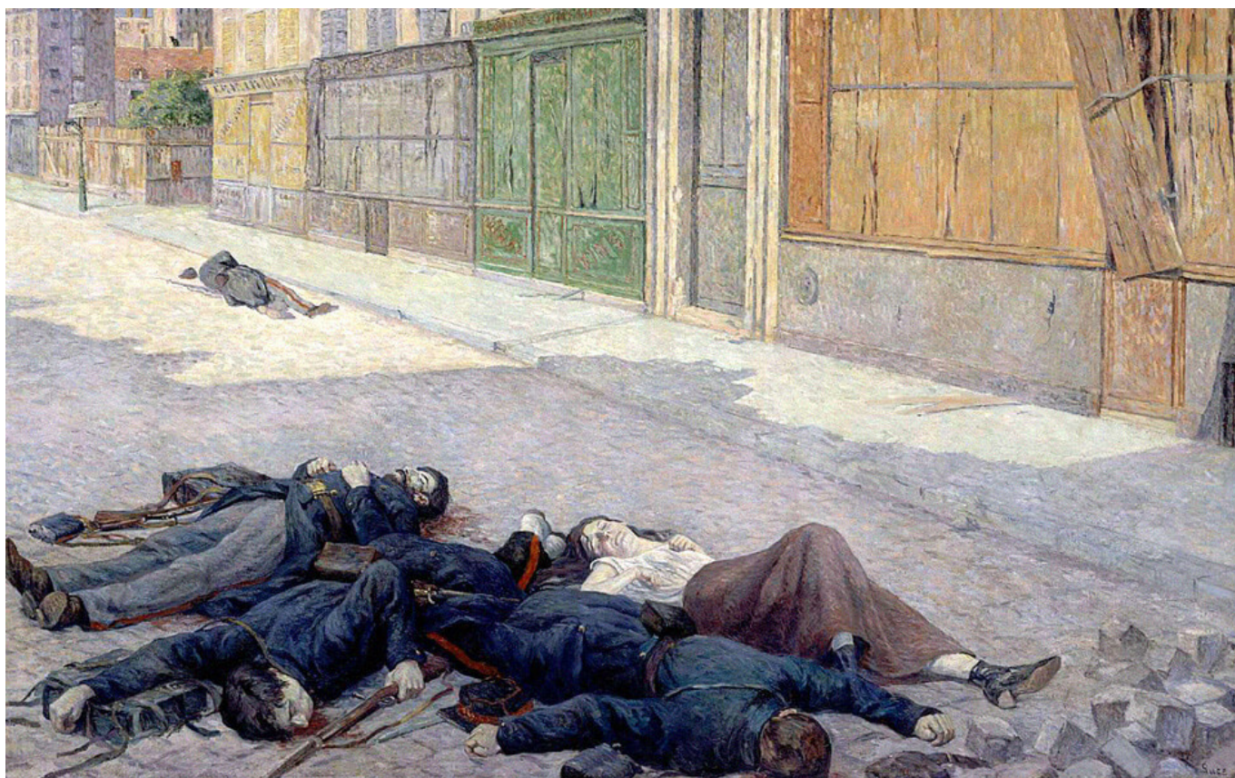
Une rue à Paris en Mai 1871 ou La Commune, Maximilien Luce, 1903