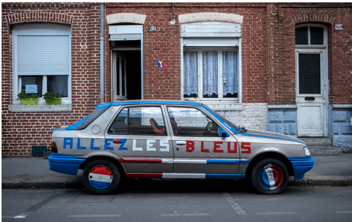
Les Racines de la colère