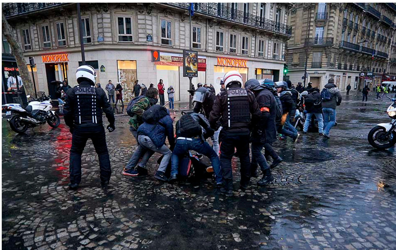
Par Cyrille Choupas