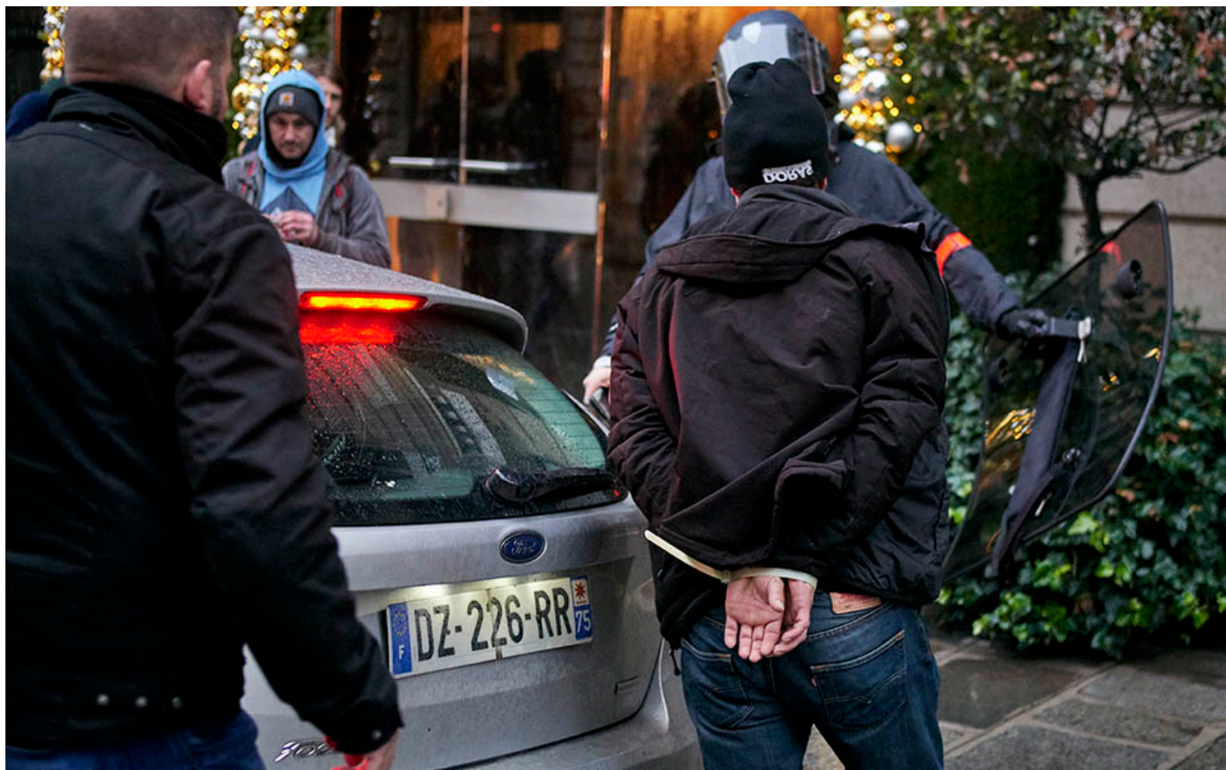
Par Cyrille Choupas