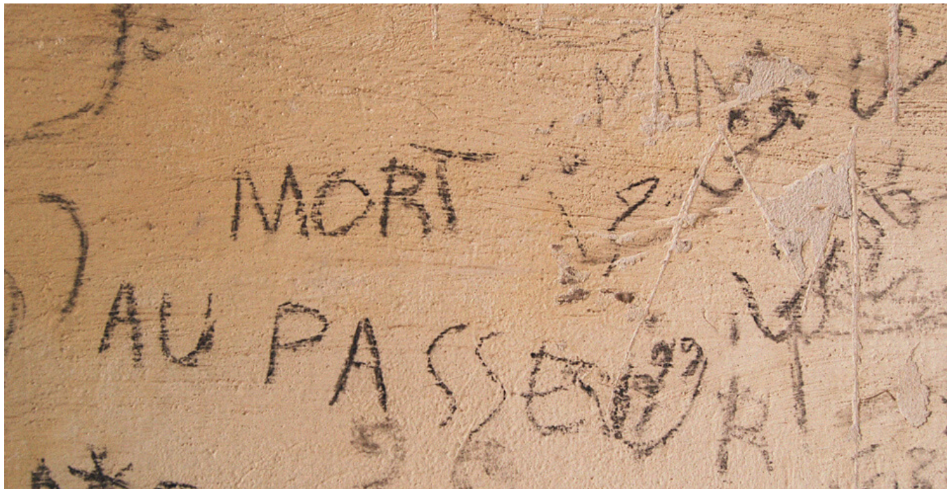
Inscriptions dans une maison abandonnée (par l'auteure)

se jetant sous un camion, en juillet 2017, dans la commune italienne de Lattes, à quelques kilomètres à peine de Vintimille.