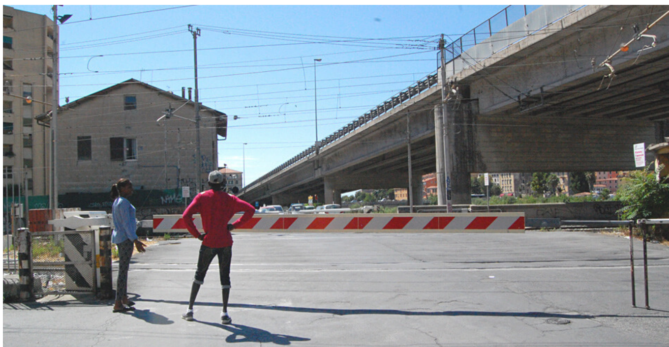
Chemin de fer de Vintimille (par l'auteure)

Ceux qui passent aussi clandestinement la frontière sont des antifascistes, des Juifs, des milliers de personnes — Italiens et étrangers — qui cherchent en France asile ou travail. Au fil des années, des centaines de personnes y laissent leur peau, surtout en cherchant à franchir de nuit celui qu'on finira par appeler le Pas de la mort. » Le Pas de la mort, c'est un chemin au bord duquel on ramasse des mûres sous les feuilles des figuiers. En été, les cigales chantent fort et accompagnent le bruit de la rivière en contrebas. On pourrait s'allonger sur un coin d'herbe et regarder la vue, à couper le souffle. La France est là, à un saut de puce. Et si on pouvait voler on y serait déjà. Dans une maison abandonnée, des vêtements de voyageurs s'entassent. Sur les murs, certains ont laissé une trace de leur passage.