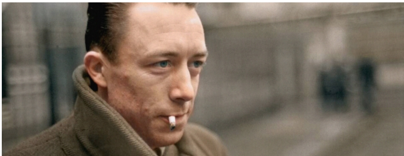
Albert Camus

« Il m'a paru à la fois indécent et nuisible de crier contre les tortures en même temps que ceux qui ont très bien digéré Melouza ou la mutilation des enfants européens. Comme il m'a paru nuisible et indécent d'aller condamner le terrorisme aux côtés de ceux qui trouvent la torture légère à porter. » Rares étaient les anticolonialistes français à dénoncer publiquement le massacre de Melouza , les exactions de l'armée française ou les violences contre les civils. Camus avait également soutenu l'appel de Messali pour la cessation des luttes fratricides entre Algériens et des attentats terroristes. L'œuvre de Camus — de L'Étranger au Premier Homme en passant par Les Justes — est suffisamment importante pour inspirer des individus aux sensibilités variées. Chacun peut y trouver des réflexions stimulantes, à condition de ne pas le lire de travers. De mon point de vue, il peut y avoir convergence avec tous ceux qui se battent sincèrement pour l'émancipation mais sans rien céder au nationalisme ou à l'obscurantisme, sans rester silencieux sur certaines dérives des « opprimés » au nom du soutien inconditionnel, sans se laisser prendre dans des alliances aux contours flous au nom de l'anti-impérialisme ou de la lutte contre la répression étatique. De la même manière, il n'y a pas lieu d'être aujourd'hui sélectif dans sa quête de la vérité ou dans ses indignations, qu'il s'agisse des disparitions tragiques d'Adama Traoré, Liu Shaoyao ou Sarah Halimi.