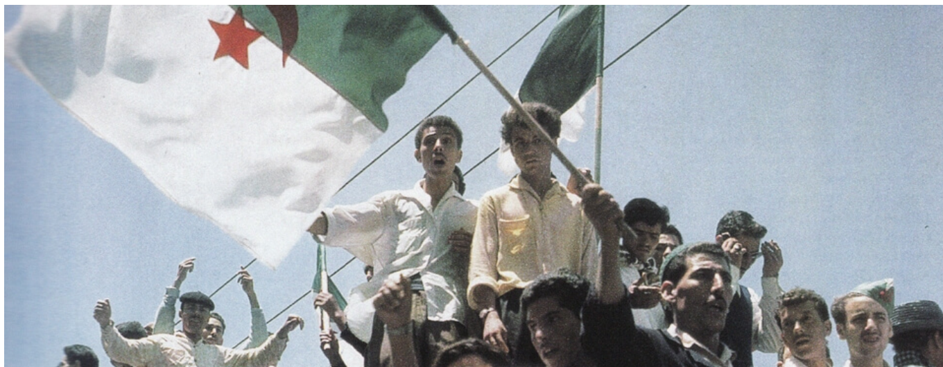
Indépendance de l'Algérie, 1962