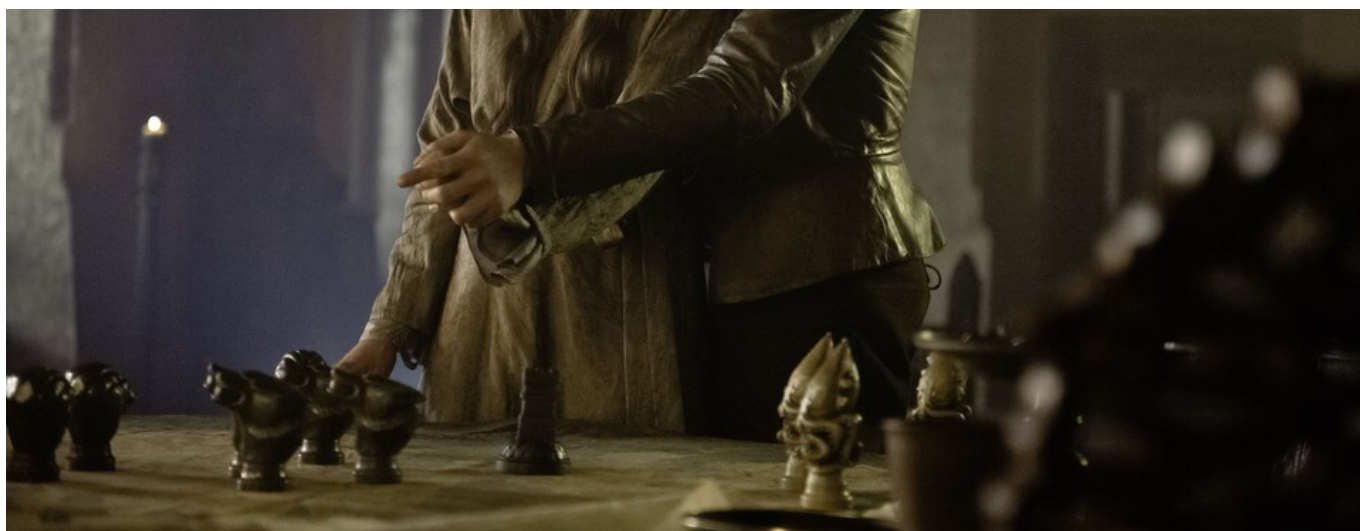
Extrait de la saison 3 de Game of Thrones - HBO