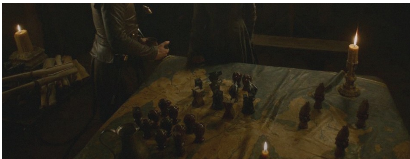
Extrait de la saison 3 de Game of Thrones - HBO