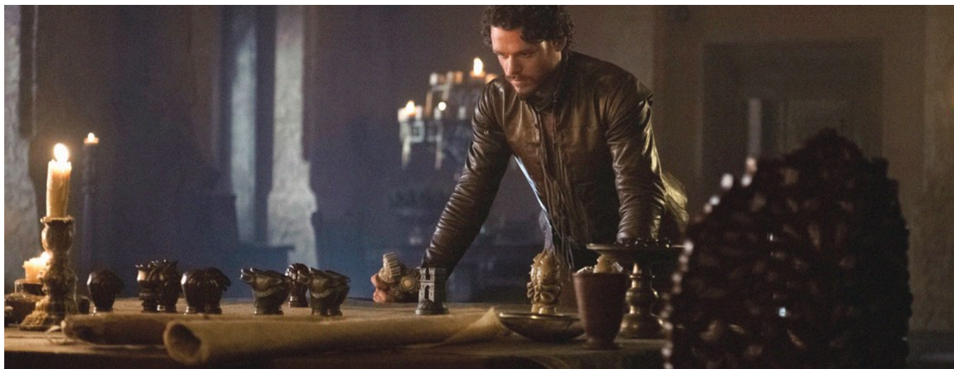
Extrait de la saison 3 de Game of Thrones - HBO