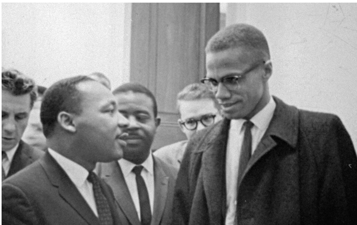
Luther King et Malcolm X

style cérémonieux et arrogant (les membres du SNCC l'appelaient « de Lawd » [Seigneur]). Ils firent de lui un bourgeois désespéré et un obstacle plutôt qu'une force positive dans la lutte de libération noire. Les libéraux blancs, redoutant des troubles au sein de la communauté noire, ont loué le pasteur comme une voix de la modération : ils espéraient qu'il pût endiguer la marée montante du mécontentement noir, qui explosait au cours des longs et chauds étés du milieu des années soixante. L'image d'un King bon teint a empêché les observateurs de donner un sens à son opposition à la guerre du Vietnam, à son appel pour un Mouvement interracial en faveur des plus démunis ainsi qu'à ses dénonciations de plus en plus virulentes contre les inégalités de classe aux États-Unis d'Amérique.