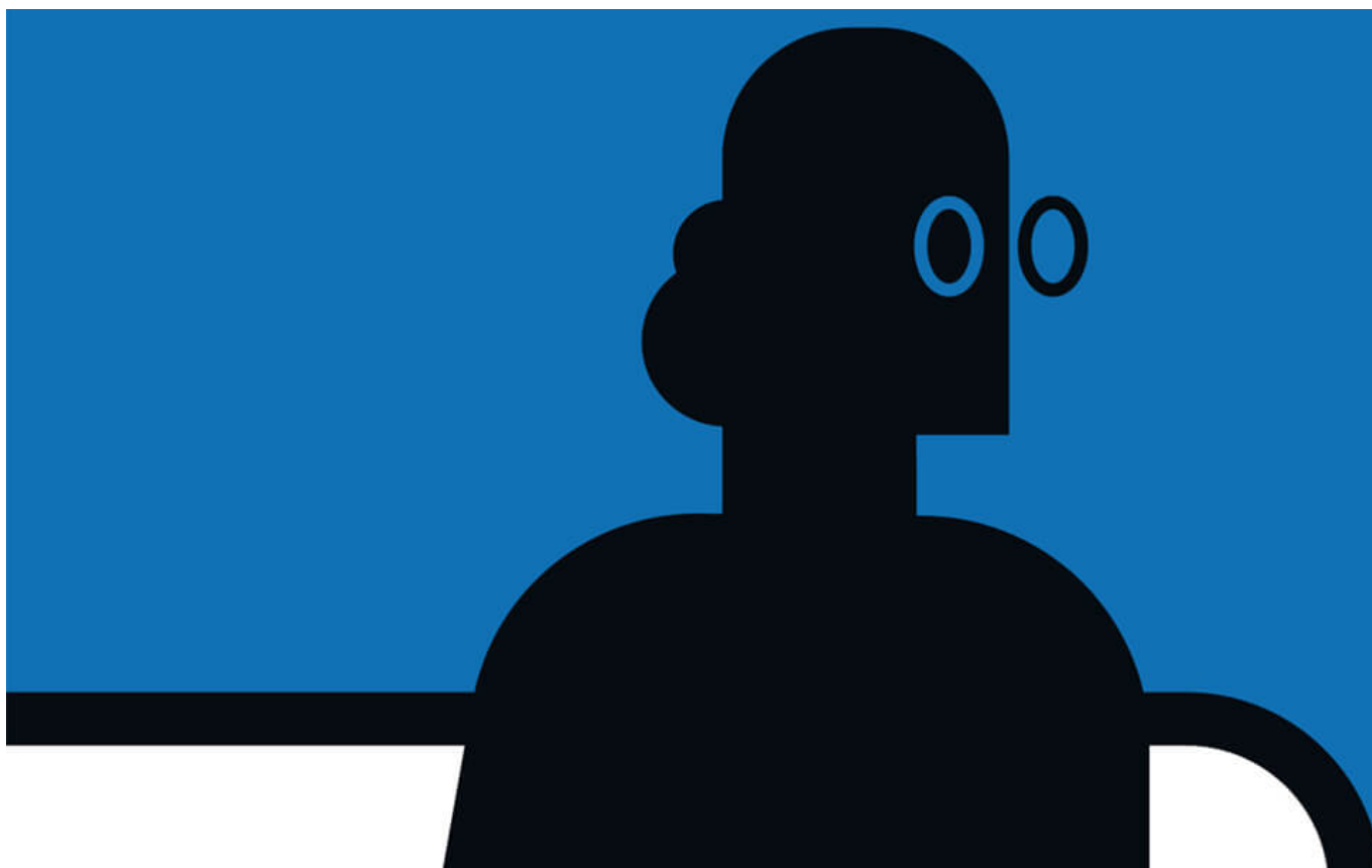
Mon histoire (2018)

« Le véritable engagement requiert une action plus directement concrète que le seul fait d'éditer des livres, sinon c'est vraiment s'en tirer à bon compte », estimait l'éditeur François Maspero. S'il est l'une de vos sources d'inspiration, pourriez-vous toutefois signer ce propos ?