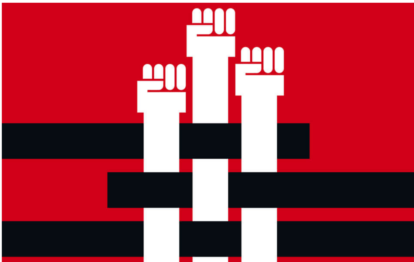
Tout est possible ! (2018), visuel : Bruno Bartkowiak