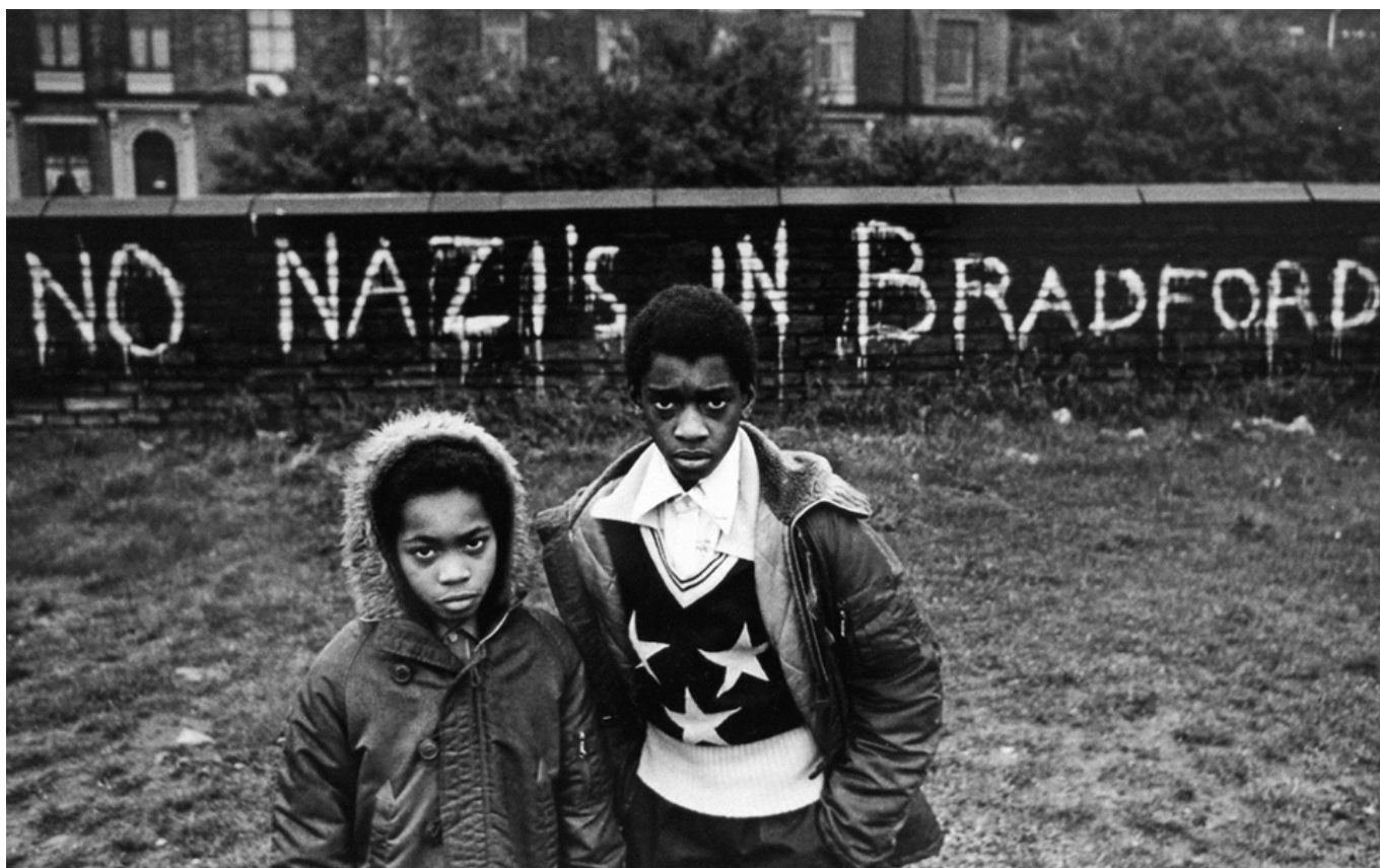
Bradford, 1972

Non : « Il y a leur Non et le nôtre, résolument incompatibles. Michel Rocard lui-même admet piteusement aujourd'hui s'être mépris sur le Non au référendum sur le traité constitutionnel européen : ce n'était pas un refus de l'Europe, c'était un Non à la dérégulation du marché du travail. Tardive lucidité ! En attendant, la construction d'une Europe libérale conçue comme une machine à briser les acquis sociaux aura réussi à compromettre l'idée européenne auprès de millions de travailleurs. » ( Prenons parti, avec Olivier Besancenot, Mille et une nuits, 2008 )