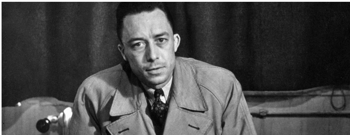
Albert Camus

Il fut toutefois reproché à Istrati, au terme de sa vie, de renier ses idéaux passés - « Involontairement, Istrati avait fait le jeu de la droite », lit-on dans Panaït Istrati, un chardon déraciné . Il publia dans la revue Cruciada (une revue « ni à gauche ni à droite ») et accepta l'argent des autorités roumaines. Quel regard portez-vous sur ce dernier chapitre de son existence ?