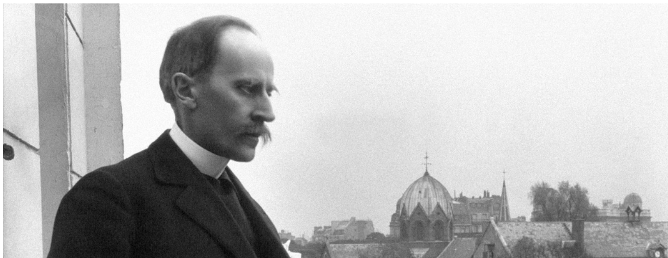
Romain Rolland