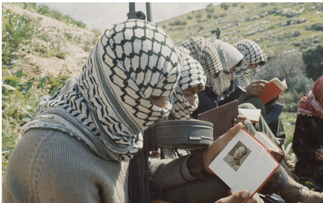
□Combattants du Fatah en Jordanie, 1970 □

L'œuvre la plus connue de Kanafani est son premier roman, Des hommes dans le soleil . Il raconte l'histoire de trois Palestiniens en exil, passés clandestinement au Koweït à l'arrière d'un camion-citerne vide. Mais leur chauffeur — un Palestinien en exil, lui aussi — étant retardé à quelque poste de contrôle, ils finissent par mourir étouffés, incapables d'appeler à l'aide. À ce propos, Edward Saïd a écrit que « poussé par l'exil et la dislocation, le Palestinien doit se frayer un chemin dans l'existence, ce qui n'est en aucun cas une réalité "donnée" ou stable pour lui, même parmi les Arabes fraternels ». Bien qu'on le connaisse principalement pour sa production littéraire, Kanafani était un artiste accompli, ayant réalisé de nombreux dessins et peintures. Il a également écrit des essais sur la littérature de résistance palestinienne et la littérature sioniste, et documenté la révolte de 1936-39 en Palestine contre les autorités coloniales britanniques, tandis que le projet sioniste et la collusion britannique devenaient de plus en plus patentes.