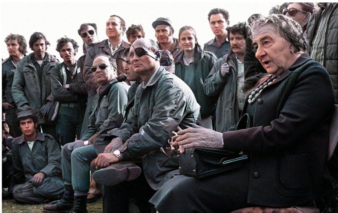
□Golda Meir (Première ministre d'Israël) et Moshe Dayan (ministre de la Défense) en 1973, durant la guerre du Kippour/Ramadan □

Son refus des discussions entre un mouvement de libération et un occupant colonial, ou «une conversation entre l'épée et le cou» , comme il le dit, ne souffre d'aucune ambiguïté. Et lorsqu'on lui demande s'il vaudrait la peine de capituler pour que cesse la mort et la misère, Kanafani n'hésite pas : «Pour nous [les Palestiniens], libérer notre pays, avoir de la dignité, du respect, avoir nos simples droits humains, est quelque chose d'aussi essentiel que la vie elle-même.» Dans une lettre adressée à son fils, il a expliqué la signification de l'appartenance à la Palestine :