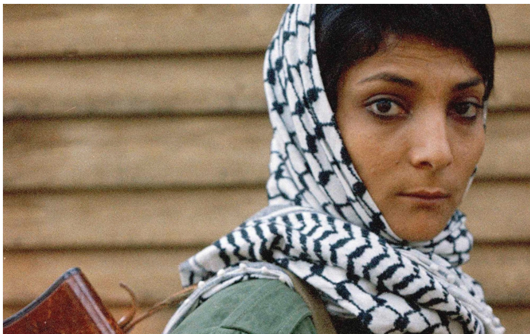
□Leïla Khaled, militante emblématique du FPLP, dans les années 1960/70 □