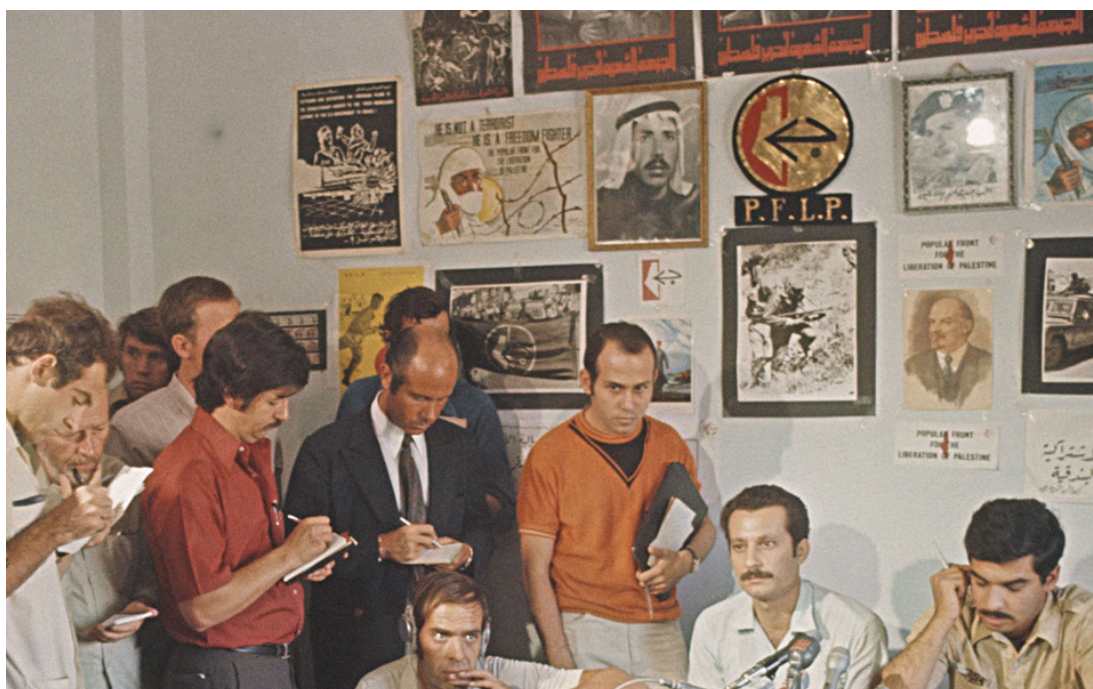
□Ghassan Kanafani (assis à gauche), lors d'une conférence de presse du FPLP, en Jordanie, le 16 septembre 1970□

En 1969, dans le document »Stratégie pour la libération de la Palestine« , l'adoption d'une perspective marxiste par le FPLP est manifeste :